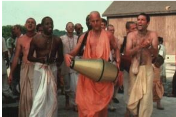
מאמיני כת "הארי קרישנה"

אם ישאל השואל: והלא כל איש-עסקים שואף להגדיל את עסקיו ולמקסם את רווחיו! יש להשיבו: אף כשמדובר באנשי עסקים, ההבחנה ברורה ביותר בין עסקי-נוכלות לבין עסקים שביושר, בין רווחים שהושגו בדרכי מירמה לבין רווחים הוגנים. אינו דומה מנהל עסק כלכלי, העומד בראש פירמידה של עובדים רבים, אשר פועלים למען העצמת רווחי העסק, בתוך מערכת יחסים של עובד-מעביד, ל"גורו" העומד בראש פירמידה של "עסקי-רוח". "עסקיה" של הכת חדלים להיות לגיטימיים משעה שמנהיגיה אינם בוחלים בנקיטת פעולות ודרכים שיש בהם משום מניפולציה על המחשבה של הפרט, ובטכניקות שתלטניות מבית היצר של תורת-הפסיכואנליזה, בשיטות של אוטו-סוגסטיה, "שטיפת-מוח" ( Mind Control ), היפנוזה, צ'אנטינג, אודיטינג ועוד.