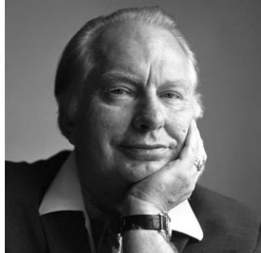
ל. רון האברד – "סיינטולוגיה"

לסיכום , נציין, כי כתות רבות נוקטות בדרכי אונאה בלתי לגיטימיות – תוך התחזות להיות מי שהם אינם. לשם כך, לומדים מדריכי-הכתות (ה"אודיטורים") קורסים רבים, בהם מקנים להם מיומנויות בהשפעה פולשנית ובהתערבויות עמוקות בנפש האדם. טכניקות המעוררות אירועים מנבכי העבר על מנת "להתנקות" או "להיטהר", מצויות לרוב בכל הכתות. כמו כן, נעשה בהן שימוש בתהליכים של אוטו-סוגסטיה, טכניקות של היפנוזה אוטוריטיבית 14 וכיו"ב שיטות של הפעלת השפעה לשינוי