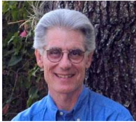
גלגולי נשמות וחזרה לעבר: פרופ' בריאן וייס

אפקט נוסף שנעשה בו שימוש נפוץ בכתות: ראשי כת ה"סיינטולוגיה" 12 נוהגים להעביר למאמיניהם מסר, לפיו הם מתיימרים להיות בעלי הידע ה"אמיתי", ה"מוחלט" וה"בלעדי" בבכני נפש האדם. המוטו של "רק אנחנו המבינים" ו-"האמת נמצאת אצלנו", או "כל האחרים טועים / משקרים" – חוזר על עצמו, בוריאציות שונות, בכל הכתות. פועל-יוצא מכך הוא, שאנשי הכתות מתנגדים למדע, ובפרט למדעי הפסיכולוגיה והפסיכיאטריה, ואף יוצאים חוצץ כנגד מחקרים מדעיים בתחומים אלו בכל הזדמנות, בריש גלי. הטעם – ברור: מחקרים פסיכולוגיים או פסיכיאטריים עלולים לסתור את אמונותיהם ולפרוך את האידיאולוגיה בה הם דוגלים. האמת המדעית עלולה ליצור בלב מאמיניהם 'דיסוננס קוגניטיבי', לערער את אמונתם, ובזאת הם אינם מעוניינים, כמובן. התנגדותם למחקרים מדעיים מוצאת את ביטויה הן בפירסומים פנימיים של הכת, והן בהתבטאויותיהם כלפי חוץ. לא בכדי התנגד ל. רון האברד 13 , מייסד ה"סיינטולוגיה", לכל תחרות שהיא על 'תורת נפש האדם' שלו. הוא